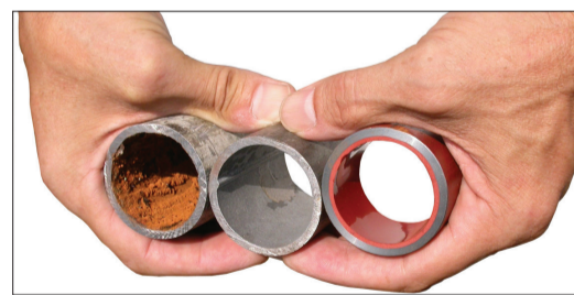
Verschmutztes, gereinigtes, beschichtetes Rohr.

werden die Rohre innen mit einer speziellen Beschichtung versiegelt und langlebig geschützt. Das Endprodukt ist ein Art «Rohr-in-Rohr-System», das den heutigen Kunststoffrohren punkto Dauerhaftigkeit und Qualität in nichts nachsteht.