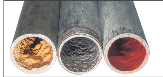
Rostiges, gereinigtes, beschichtetes Rohr.

Im Durchschnitt beträgt die Lebensdauer von Wasserleitungen 30 bis 50 Jahre, je nach Wasser- und Materialqualität. In Wasserleitungen aus verzinkten Eisenrohren oder aus Kupfer bilden sich nach etwa 10 bis 15 Jahren unweigerlich Rost- und/oder Kalkablagerungen. Gründe gibt es viele: Verunreinigungen, Erosionskorrosion durch Sand, Lochfrass in Kupferrohren durch eingeschwemmten Rost usw. Die Ablagerungen bauen sich über die Jahre langsam auf und werden erst bemerkt, wenn rostbraunes Wasser, Rostgeschmack, Druckabfall, ein dünner Wasserstrahl oder ein Wasserrohrbruch auftritt.